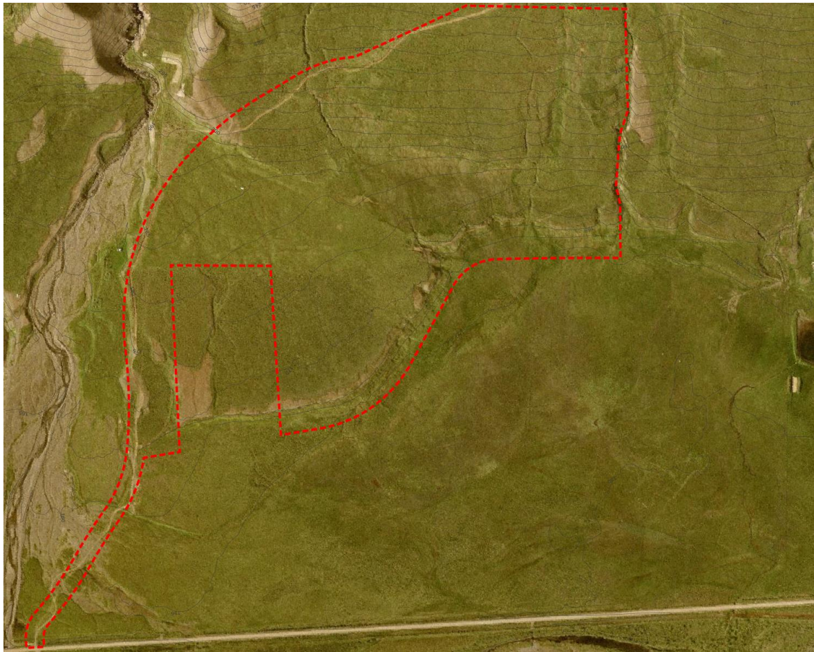
Mynd 2. Afmörkun skipulagssvæðisins fyrri áfanga deiliskipulagsins.