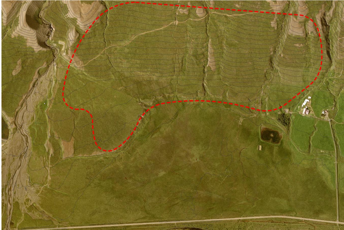
Mynd 1. Afmörkun skipulagssvæðisins eins og gert var ráð fyrir að hún yrði skv. skipulagslýsingu.