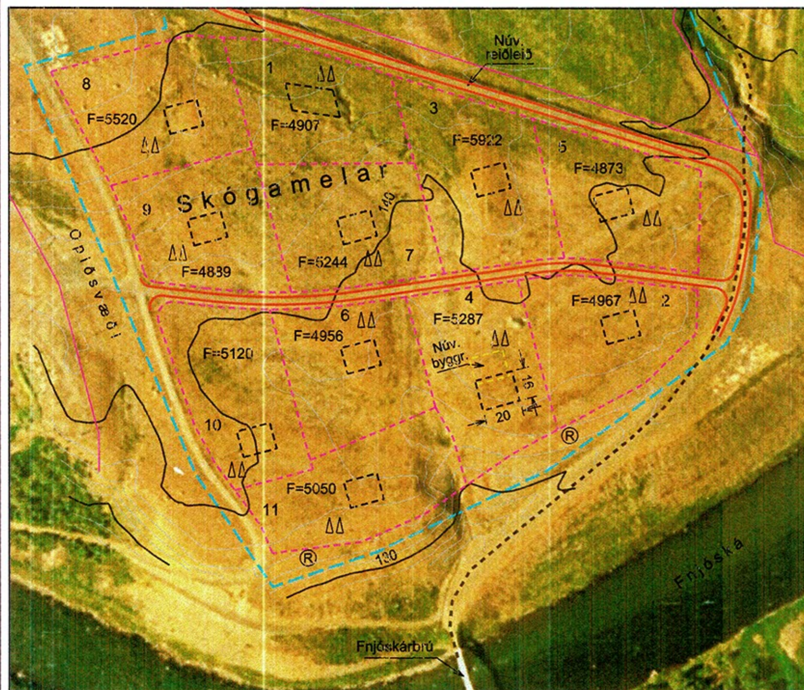
Breytt deilisk. - mkv. 1:2000