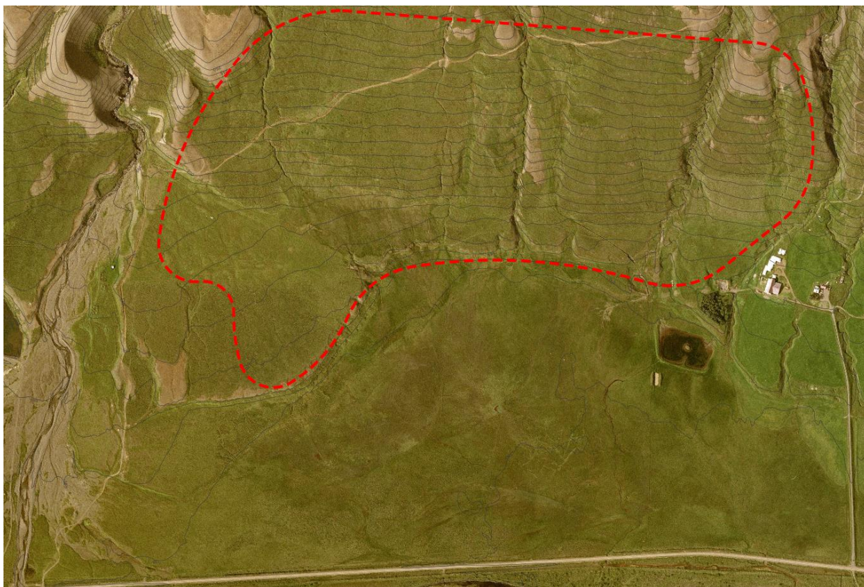
Mynd 1. Afmörkun skipulagssvæðisins eins og gert var ráð fyrir að hún yrði skv. skipulagslýsingu.

Hlíðin innan skipulagssvæðisins er með aflíðandi halla frá vestri niður til austurs og er hæðarmunur innan svæðisins um 80 m (170-250 m.y.s). Gróðurfar í hlíðinni einkennist af mólendi en í gegnum skipulagssvæðið liggur vegslóði frá Grjótá í suðri og upp hlíðina til norðvesturs.